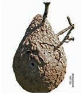
Nestbau der asiatischen Hornisse mit seitlichem Eingang.