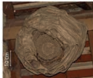
Nestbau der europäischen Hornisse mit Eingang unten/Nest nach unten offen.

Die asiatische Hornisse ist eine invasive, gebietsfremde Hornisse, die sich sehr schnell in der Schweiz verbreitet. Sie benötigt viel Nahrung, um ihre Brut zu füttern. Dadurch bedroht sie einheimische Insekten, darunter Wild- und Honigbienen. Durch Frass an reifen Früchten kann sie Schäden im Obst- und Weinbau verursachen.